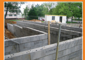
Les travaux d'accessibilités ont commencé