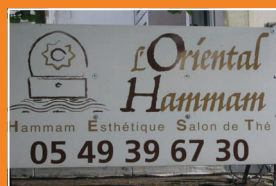
L'Oriental Hammam s'agrandit