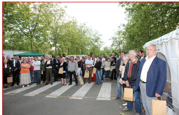
De nombreux visiteurs sont venus durant ces deux journées

Nous remercions ceux qui sont venus nous rencontrer.