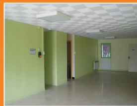
Futur Relais d'assistantes maternelles

L'ORIENTAL HAMAM, déjà présent au centre commercial des Templiers à Beaulieu, s'agrandit. Le nouveau local situé au 19 Place Philippe le Bel ouvrira courant juin 2008. Des soins du corps et de détente vous seront proposés (relaxation, massage, soins anti-âge et épilation durable).