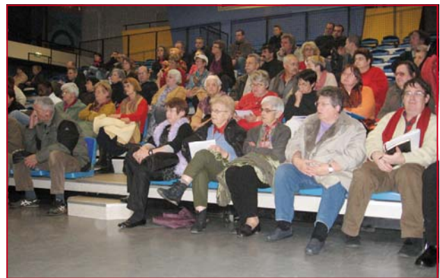
80 personnes étaient venues s'informer des avancées du projet

La réhabilitation et la restructuration de l'immeuble emblématique du 1 à 11 rue René Amand. Un concours de maîtrise d'œuvre a été lancé pour travailler sur ce projet. 26 candidats ont répondu et 4 ont été retenus par le jury fin novembre pour présenter un projet : Flint (Bordeaux), SAO (Paris), ARCAU (Vannes), Lance-reau Meyniel (Poitiers). Fin mars un des quatre candidats sera choisi.