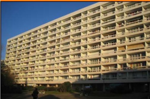
Place de Bretagne

D'autre part, suite aux problèmes récurrents de l'inondation des sous-sols, des études ont été faites. Nous n'avons pas la possibilité, pour des raisons de sécurité, de creuser le sol.