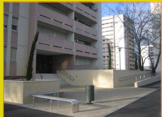
9 rue Henri Dunant