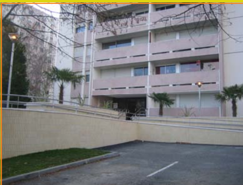
11 rue Henri Dunant