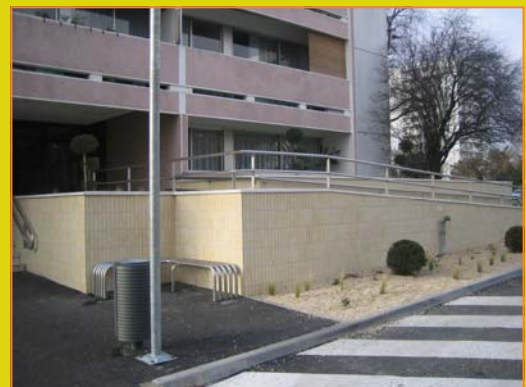
13 rue Henri Dunant

Les travaux d'accessibilité et de convivialité devant les résidences de la rue Henri Dunant se sont terminés par la pose des luminaires, des bancs et des corbeilles à papiers. Nous demandons à chacun de respecter ces aménagements notamment les parties arborées pour le bien être de tous. D'autre part, SIPEA va faire procéder à la remise en peinture des 6 cabines d'ascenseurs au niveau des parois, murs et plafonds. Les sols seront également changés. Enfin, nous allons prochainement procéder à la réfection des nez de marches des escaliers extérieurs qui ont été dégradés.