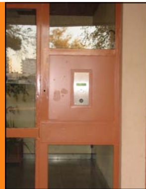
Une platine d'interphonie repeinte

Ainsi, nous ne pouvons pas faire de saignée ni de fosse pour faciliter l'évacuation de l'eau et installer une deuxième pompe. Cependant, nous avons remplacé la pompe existante par une pompe neuve plus performante. Enfin, suite aux dégradations, une remise en peinture a été effectuée autour des platines d'interphonie d'accès à l'immeuble.